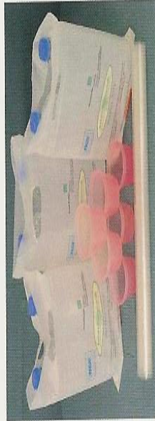
Producten uit Biograde 200C.

len of volgapparaatuur moet worden aangepast. Het spuitgieten kan plaatsvinden met conventionele machines.