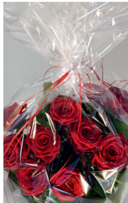
Bild 5. Transparente, reißfeste Blumenfolie aus Bio-Flex CL

Während die Knappheit von Ecoflex den Markt etwas lähmt, wird das Polybutylen-Succinat (PBS; Markenname: GS