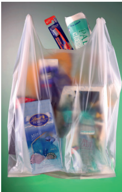
Bild 3. Tragetasche aus Copolyester/PLA-Compound Ecovio

Rodenburg aus den Niederlanden zeigte seine neue spritzgießbare thermoplastische Stärke Solanyl BP. Diese wird aus Kartoffelschalen, also Abfällen hergestellt und, so betont das Familienunternehmen Rodenburg, tritt somit nicht in Konkurrenz zur Nahrungsmittelproduktion.