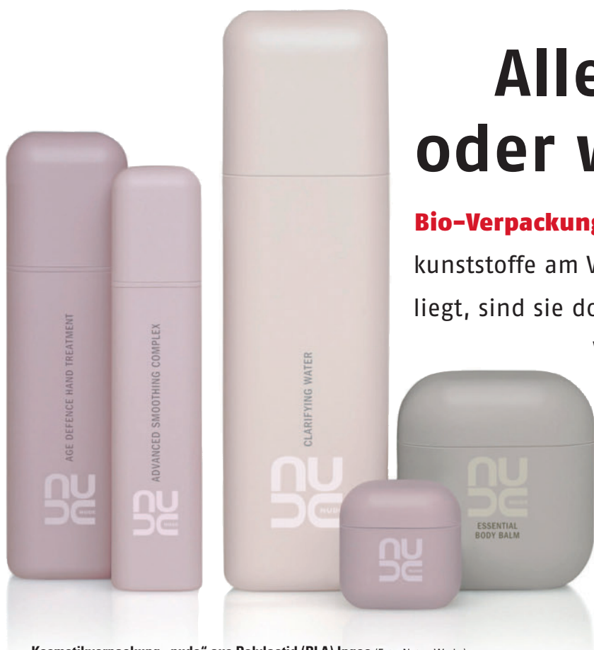
Kosmetikverpackung „nude“ aus Polylactid (PLA) Ingeo

Verpackungsbranche (und anderer Branchen) geworden. Dies machte die diesjährige Interpack in Düsseldorf deutlich. Laut Aussagen der Aussteller boomt derzeit der Markt für Biokunststoffe und ist von zahlreichen Innovationen geprägt.