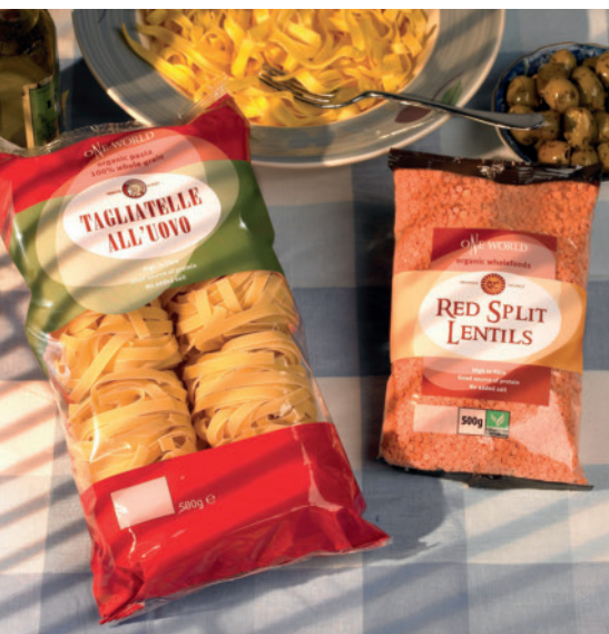
Bild 7. Nudel- und Gewürzverpackung aus Natureflex

Das FKUR präsentierte sein neues transparentes Bio-Flex CL. Dem FKUR ist es damit gelungen, ein additiviertes, transparentes PLA-Blend zu entwickeln, das sich auf herkömmlichen PE-LD-Blasfolienanlagen verarbeiten lässt. Darüber hinaus wurde das neue Bio-Flex 467 F vorgestellt, ein Bio-Kunststoff mit PE-HD vergleichbaren Eigenschaften in Verarbeitung und Anwendung. Aufgrund der harmonischen Kombination aus Festigkeit und Elastizität sei dieser Werkstoff besonders für Tiefkühlverpackungen ge-